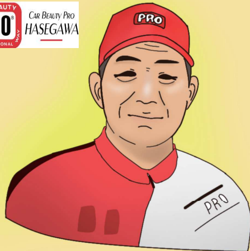
カービューティプロ長谷川

私に任せてください。 シート取り外し、フロアマットも剥がして徹底的に水洗いし、天日で乾燥、除菌します。匂いはほとんど残りません。